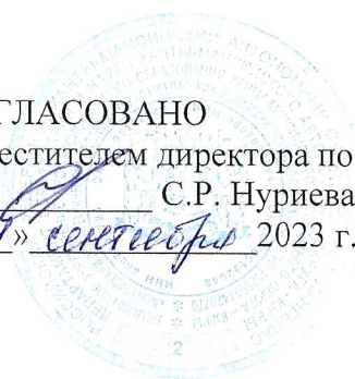
ГРАФИК КОНСУЛЬТАЦИЙ ПРЕПОДАВАТЕЛЯ